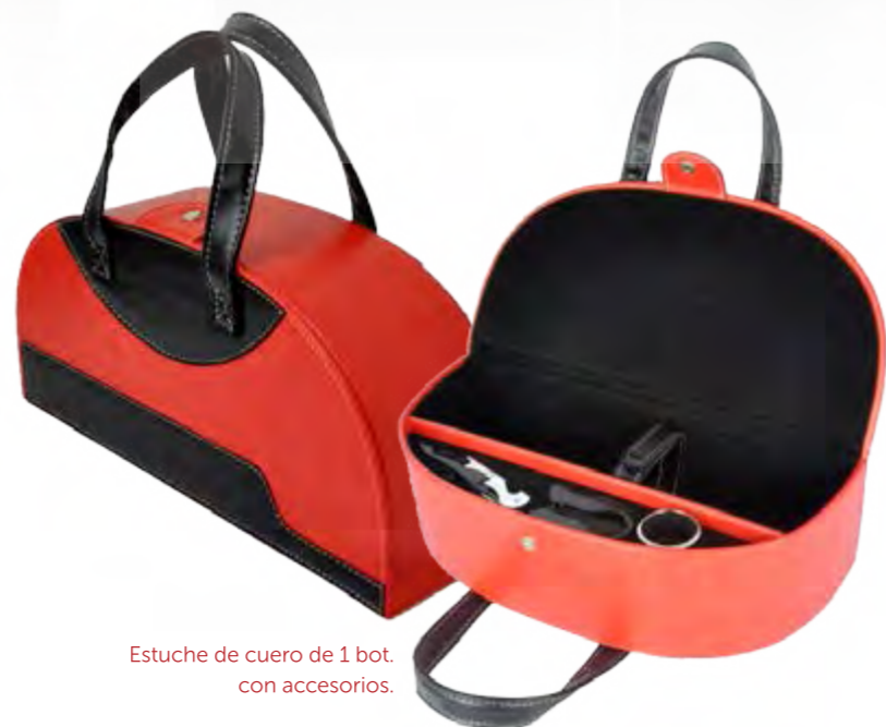
Estuche de cuero de 1 bot. con accesorios.

V1 Estuche de Cartón Original de la Bodega con 3 Botellas de MI MAMÁ ME MIMA 75 cl. 24,90€