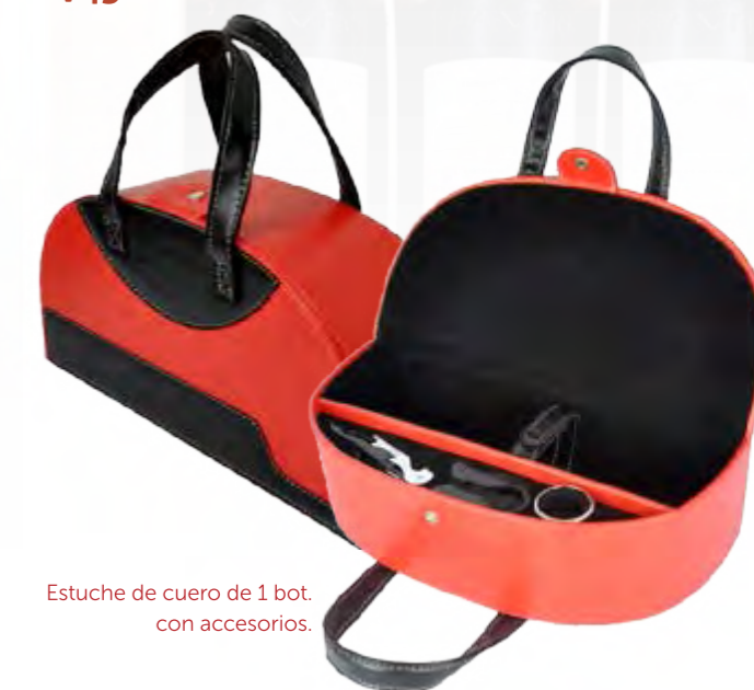
Estuche de cuero de 1 bot. con accesorios.