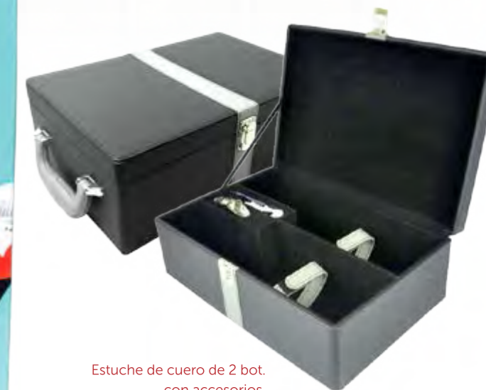
Estuche de cuero de 2 bot. con accesorios.

V7 Estuche de Cartón Original de la Bodega con 3 Botellas de CONDES DE ALBAREI 75 cl.