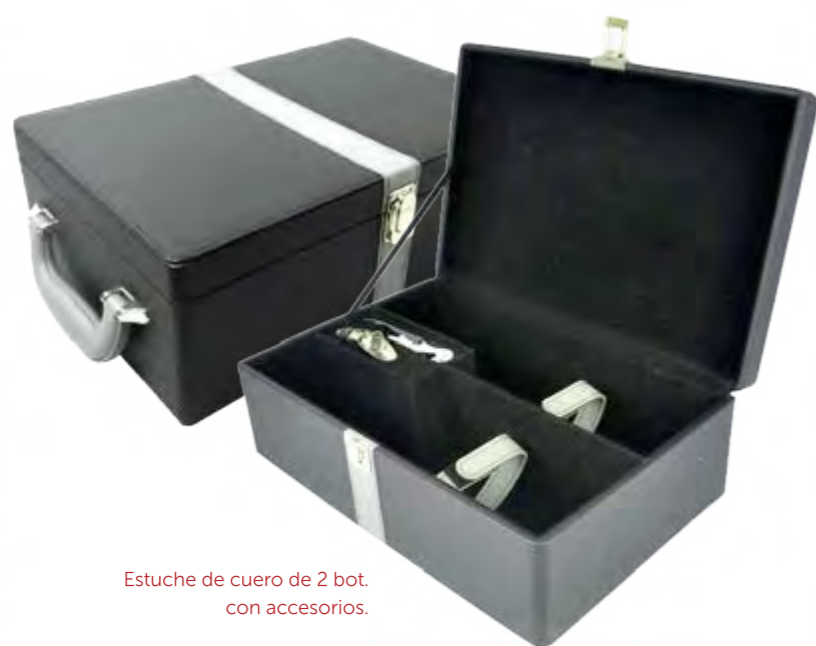
Estuche de cuero de 2 bot. con accesorios.