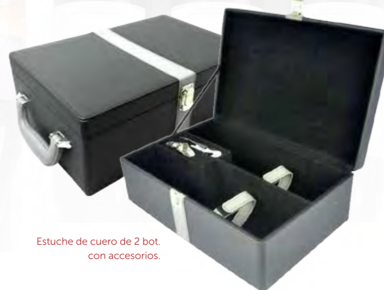
Estuche de cuero de 2 bot. con accesorios.