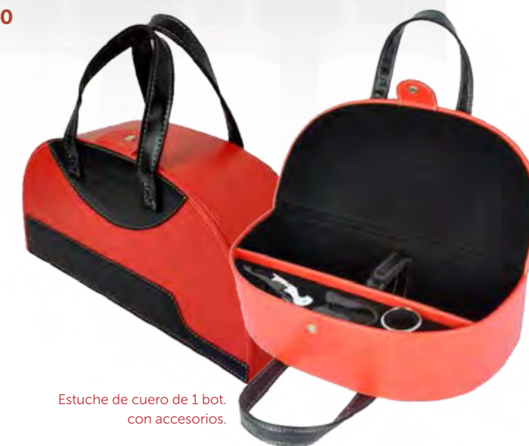
Estuche de cuero de 1 bot. con accesorios.

V19 Estuche de Madera con 3 Botellas de TOBELOS Crianza 75 cl.